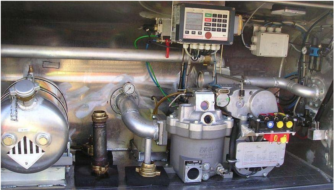
Armaturenschrank einer Tankwagenmessanlage